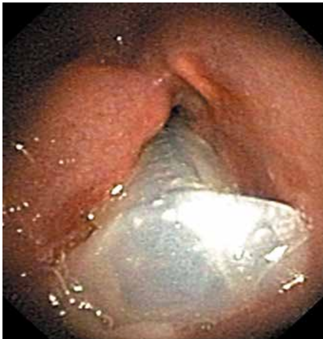
Рис. 2. Эндопротез в просвете гортани Fig. 2. Endoprosthesis in the laryngeal lumen

гиперемированной, отмечался незначительный отек слизистой зоны черпаловидных хрящей. Умеренные явления хондроперихондрита установлены у 7 (9,5 %) из 74 больных. На передней стенке оперированной гортани наблюдался налет фибрина.