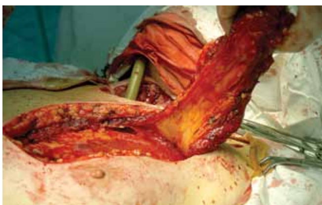
Рис. 3. Мышечная ножка пекторального лоскута сформирована без истончения для предупреждения сдавливания питающих сосудов при ротации лоскута

Пациент оперирован — выполнено иссечение паратрахеостомического рецидива с резекцией 4 полуколец трахеи в пределах здоровых тканей с определением границ резекции дооперационно (в том числе эндоскопически и по данным КТ). Интубация через опухолевую ткань, обуславливающую стеноз, интубационной трубкой № 4 с высокочастотной искусственной вентиляцией легких. После удаления опухоли — переинтубация армированной интубационной трубкой № 8,5 соответственно диаметру трахеи.