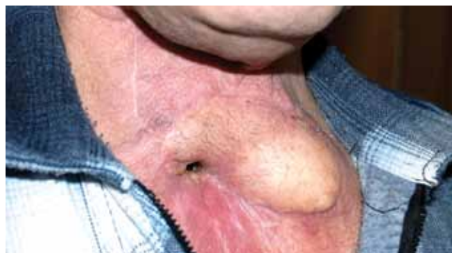
Рис. 6. Некоторая дислокация трахеи вправо мышечной ножкой лоскута в связи с развитием некоторого избытка массы тела

торального лоскута из-за ее большего перегиба в данном положении (рис. 3, 4).